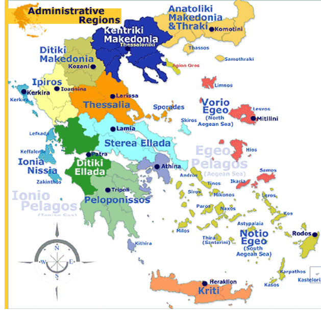
Şekil 2 – Yunanistan'da bölgesel parlamentoların kurulduğu NUTS 2 bölgeleri

Ülkelerin idari yapısını değiştirmeyi öneren bir sistem olmamakla beraber, bu sistem bize yine de önemli düşünme olanakları sağlıyor. Örneğin Yunanistan'ın 2010'da yaptığı ilk bölgesel parlamento seçimlerinde esas aldığı bölgeler ülkeyi 13 bölgeye ayıran NUTS 2 bölgeleridir (Şekil 2). Almanya gibi idari yapısı federasyon olan bir ülkede eyaletler NUTS 1'e denk düşmektedir. İspanya, İtalya, Hollanda gibi farklı bölgesel özerklik modelleri kullanan ülkelerde de bu bölgesel sistem bir şekilde NUTS sistemine uyarlanmıştır.