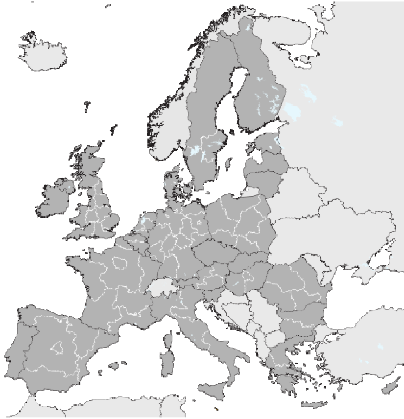
Şekil 1a – NUTS 1 bölgeleri