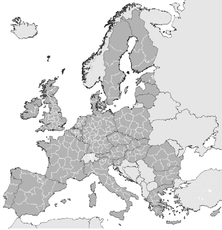
Şekil 1b – NUTS 2 bölgeleri