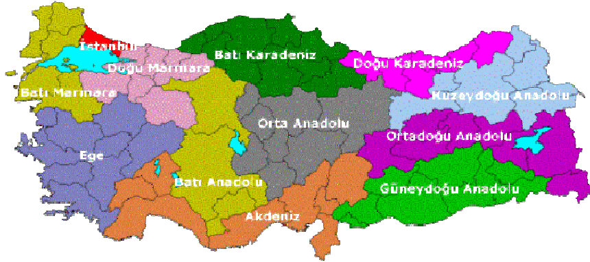
Şekil 4 – Türkiye’deki 12 NUTS 1 bölgesi

Türkiye’de NUTS sistemine göre en büyük 12 bölge ise şunlardır: İstanbul (yine tek başına bir bölgedir), Doğu Marmara, Batı Marmara, Ege, Batı Anadolu, Orta Anadolu, Akdeniz, Batı Karadeniz, Doğu Karadeniz, Ortadoğu Anadolu, Kuzeydoğu Anadolu, Güneydoğu Anadolu. Bu bölgelendirme de halen TÜİK ve diğer kurumlar tarafından istatistiksel amaçlı olarak kullanılmaktadır (Şekil 4). En küçük bölgeler olan NUTS 3 bölgeleri ise mevcut 81 vilayettir.