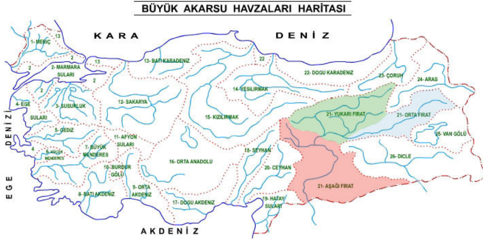
Şekil 5 – Türkiye’deki 28 akarsu havzasının sınırları

Akarsu havzaları özellikle su yönetiminde ve doğal yaşam arařtırmalarında önemi olan doğal sınırları belirler. Biyobölge yaklaşımına en uygun doğal sınırların akarsu havzalarında kendini gösterdiğini söyleyebiliriz. Türkiye’de Gediz, Susurluk, Ceyhan, Seyhan, Yeşilırmak, Kızılırmak gibi toplam 26 (veya Fırat havzası aşağı, orta ve yukarı olmak üzere üçe bölündüğünde 28) akarsu havzası bulunur (Şekil 5).