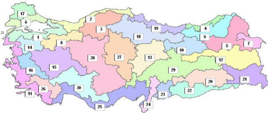
Şekil 6 – Türkiye’de Tarım ve Köyşleri Bakanlığı tarafından belirlenen 30 tarım havzası

Tarım havzaları ise Tarım ve Köyşleri Bakanlığı tarafından “Ekolojik olarak benzer olan, ülkenin idari yapılanmasına uygun, yönetilebilir büyüklükte ve tarım ürünlerinin ekolojik ve ekonomik olarak en uygun yetiştirilebildiği bölgeleri ifade edecek şekilde” belirlenmiştir. Tarım havzalarının belirlenmesinde amaç elbette tarımsal üretimin daha iyi yönetilmesidir. Ancak bölgeler belirlenirken iklim, toprak, arazi sınıflandırması, topografya ve yetiştirilen ürünler gibi çok detaylı ekolojik ve tarımsal veriler kullanılmıştır. Bu çalışmada binlerce veri değerlendirilerek Türkiye önce iklim, topografya ve toprak verilerine göre 190 tarım havzasına ayrılmış, daha sonra bu bölgelerin sayısı ürün desenleri, yönetilebilirlik ve ekolojik benzerlikler dikkate alınarak 30’a indirilmiştir (Şekil 6) 12 .