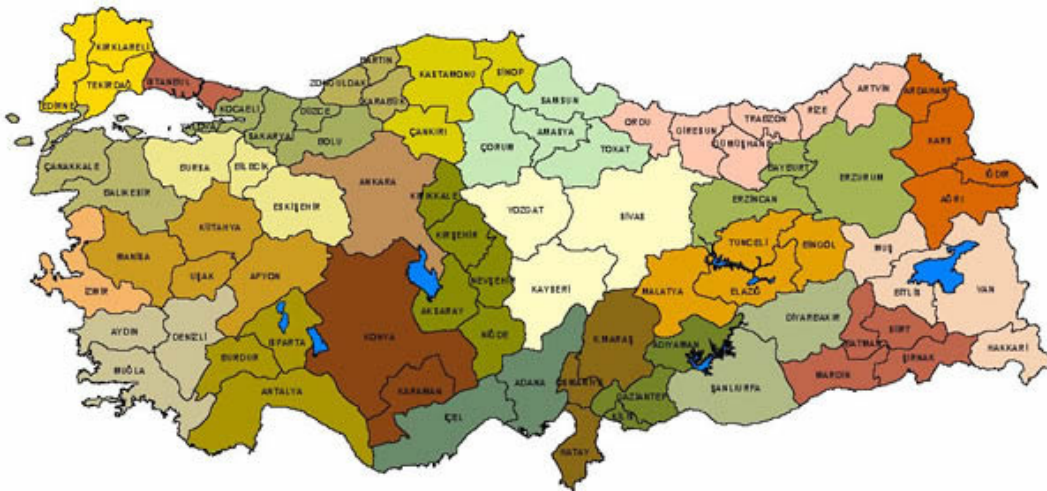
Şekil 3 – Türkiye'deki 26 NUTS 2 bölgesi

Türkiye'deki NUTS 2 bölgeleri ise her biri ortalama olarak yaklaşık 3 vilayeti bir araya getiren 26 bölgedir. İstanbul, Ankara ve İzmir'in ayrı birer bölge olduğu NUTS 2 sisteminde örneğin Kayseri, Sivas ve Yozgat, Kayseri NUTS 2 bölgesini, Mardin, Batman, Şırnak ve Siirt, Mardin NUTS 2 bölgesini oluştururlar. Bu sistem halen AB uyum sürecinin bir parçası olan bölgesel kalkınma ajanslarının kurulması için kullanılmaktadır (Şekil 3).