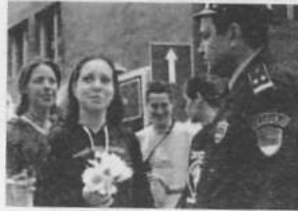
Otpor! eylemcileri, polisle karşı karşıya.

koruyabildik ve hareketin büyümesini sağladık. Olumlu söylemimiz, eylemcilerimizi sadık bir şekilde desteklememiz ve hareketimizin büyümesi, Sırbistan'da bir şeyleri değiştirdi. Yönetimin baskısı