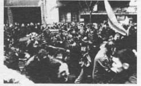
Polis, Otpor!'un düzenlediği bir protesto gösterisini dağıtıyor.

Dışarıda bizi yüz kadar öğrenci ile, anlatacaklarımızı dinlemek ve resimlerimizi çekmek isteyen birçok gazeteci karşıladı. İlk göz altına alınan arkadaşımız da serbest bırakılmıştı ama ne yazık ki kötü dayak yemişti. Her şey bittikten sonra, neden o kadar hızlı bir şekilde serbest bırakıldığımızı ve polislerin sınırlarının neden bozulduğunu öğrendik. Siyasi partiler ve sivil toplum örgütleri, gözaltına alınmamızı protesto eden bir mektubu bütün dünyaya göndermişlerdi, birkaç dakika içerisinde de, birçok uluslararası kuruluş ile sivil toplum örgütü de protestoya destek vermişti.