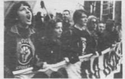
Otpor!'un düzenlediği bir protesto gösterisi

B Planının daha geniş bir düzlemde etkisini anlamak için, Otpor!'un toplum üzerindeki genel etkisine bakmak gerekir. Slobodan Milosević'in on yıllık iktidarından sonra, Sırlar daha iyi bir gelecek olabileceğine dair ümitlerini yitirmişlerdi, artık direniş için bir motivasyon kalmamıştı. Otpor! işte böyle bir dönemde, insanlara harekete geçme imkanı sundu. İnsanlar, değişimin mümkün olduğuna inanmaya başladı, bu sürecin sonunda da devrim gerçekleştirdi. Eylemcilere mücadelelerini sürdürmek için destek veren ve yönetimin baskıcı taktiklerini gayri meşru hale getiren B Planı taktiği, bu süreci daha da güçlendirdi.